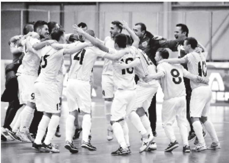
A továbbjutást ünneplik a marosvásárhelyi játékosok: az elitkörben a tisztas helytállás lehet a céljuk

A City'us a négy elitkörös részvétele során harmadszor játszik Lisszabonban (egyszer Pardubiceben, a Chrudim vendége volt), s mindig a Sporting szervezte a tornát. A házigazdák elleni