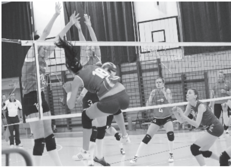
A jobban jegyzett Jászvásár elleni bajnokin nem sok jóra számítottunk, a marosvásárhelyi csapat azonban kellemes meglepetést szerzett.

Ha Pucarević magabiztosan, bár kissé sematikus irányított, Klarić pedig hozta a legjobb teljesítményt a csapatból (20 pont, két ász, két