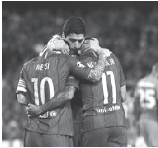
A Barcelona csatártriója az argentin sztár egyik gólját ünnepli

* D csoport: Rosztov (orosz) – Atlético Madrid (spanyol) 0-1 (0-0) / gól: Carrasco (62.); Bayern München (német) – PSV Eindhoven (holland) 4-1 (2-1) / gól: Müller (13.), Kimmich (21.), Lewandowski (59.), Robben (84.), illetve Narsingh (41.). A csoport állása: 1. Atlético Madrid 9, 2. Bayern München 6, 3. PSV Eindhoven 1 (3-7), 4. Rosztov 1 (2-8).